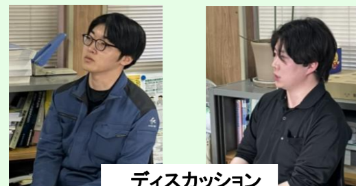
ディスカッション