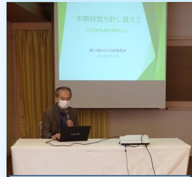
長谷川社長より 中期経営計画の説明