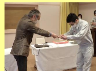
皆からたくさんの「ありがとう」 をもらいました！(相場)