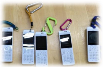
スタッフの皆様ご利用のPHS