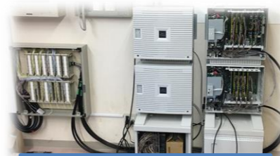
Yuiコールの制御装置