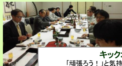
キックオフ会 「頑張ろう！」と気持ちを新たにしました