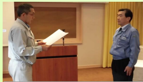
安全大会も同日に行いました (写真は「安全の誓い」)