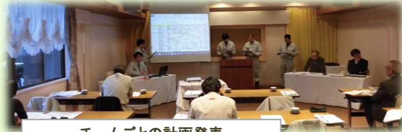
チームごとの計画発表