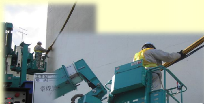
電線防護工事(鈴木) 建設工事などを行う際、電線との接触事故を防止するために電線防護管を取付けています