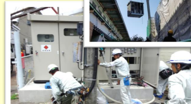
工場高圧電気設備更新工事(石井) 高圧電気設備機器(建物電気設備の心臓部)の搬入、新しい機器に取替える工事を行っています