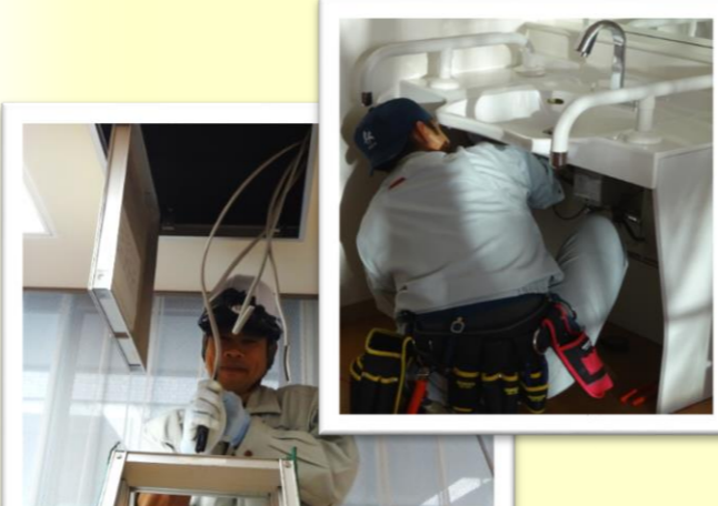
福祉施設 電気設備工事(奥田) コンセント配線のケーブル皮むき作業(左)、洗面台コンセント本体の取付(右)を行っています