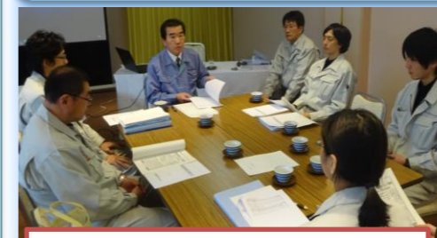
安全講和 労働災害・交通災害「ゼロ」の達成を目指し、みな真剣に講話を聞きました。