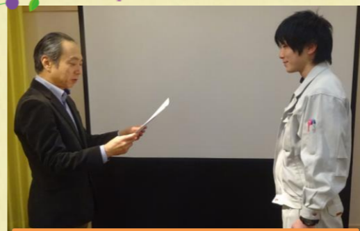
新規顧客開拓 年間No.1! 誠実さでお客様の心を掴みました。