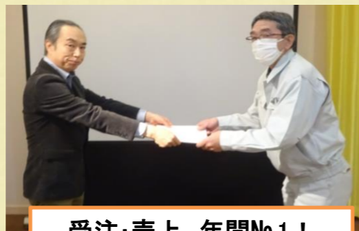
受注・売上 年間No.1! ベテランの底力を見せました。