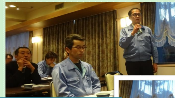
激励に来てくださった ゲストの皆様