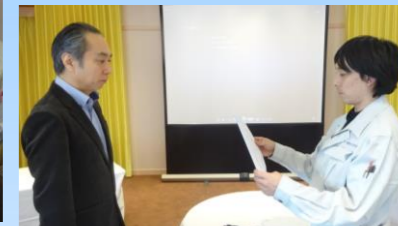
安全の誓い 今期も安全に作業に取り組むことを誓います。