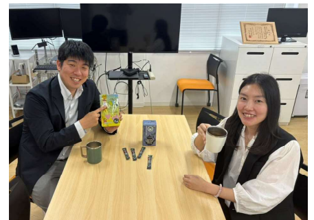
フェアトレード商品シェアの様子

など、身近にできるSDGsアクションを実践し、ポイントを獲得する形式で実施しました。イベント期間中は、LINE WORKSを活用して各チームの活動を共有し、部署や拠点を超えた交流にもつながりました。社員のみなさんからは、「普段あまり意識しなかったフェアトレードを気にするようになった」「社員とのコミュニケーションが深まった」とSDGsへの関心がより高まったイベントとなりました。今後も当社では、健康経営やSDGsへの取り組みを通じて、働きやすい職場づくりと持続可能な社会への貢献を進めてまいります。