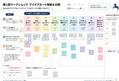
グループワークで使った アイデアカード発散&分類