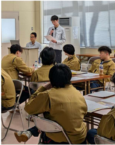
中条高等学校での講話の様子

生徒の皆様は終始真剣な表情で耳を傾けてくださり、積極的に学ぼうとする姿勢が印象的でした。