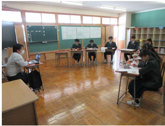
荒川中学校での講話の様子