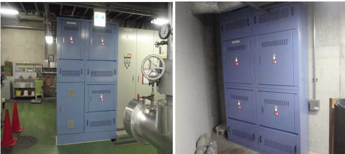
制御盤は2面になりました。毎回お客様の設置スペースに合わせて製作しています。

納入後約2ヶ月が経過しましたが、90%以上の削減率で順調に稼働しており、1年間では約560万円の電気料金の削減を見込んでいます。電気料金の値上げも予定されていますので、今後も少しでも高い削減効果が出るよう努めて参ります。